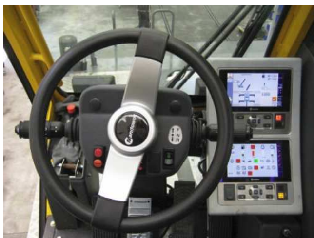
Minimální přístrojový panel pro maximální výhled