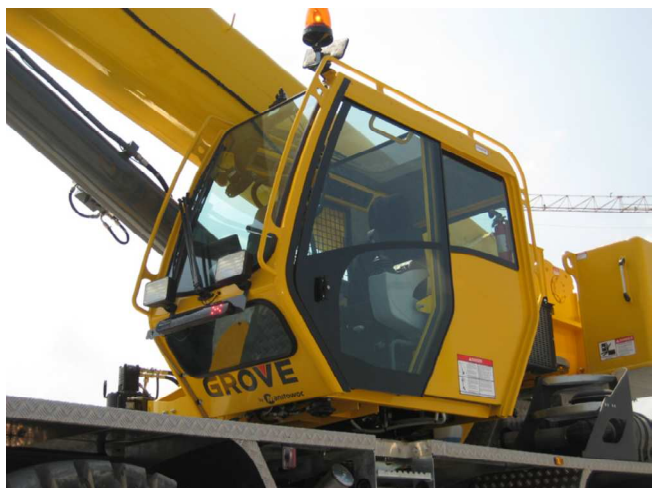
Plně prosklená, klimatizovaná kabina operátora

Polohu podpěr snímá bezpečnostní zařízení